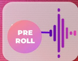
Diffusion du spot publicitaire avant le contenu