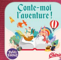
Capitaliser sur un podcast existant pour créer un épisode spécial dédié à votre marque