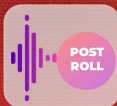
Diffusion du spot publicitaire Après le contenu