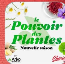
Création d'un format sur-mesure dédié à votre marque