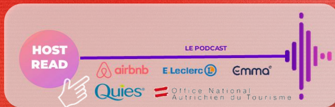
Diffusion d'un format pub écrit et lu par l'hôte du podcast avant le début du contenu